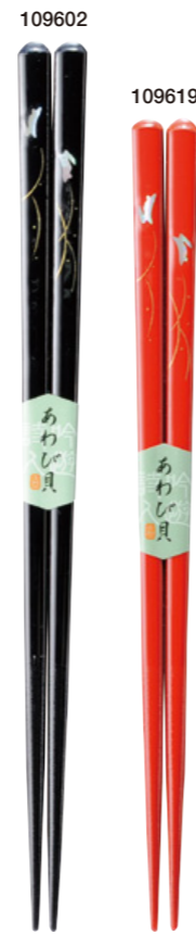
飛翔 109602 黒 23cm 109619 赤 21cm ¥1,500(+税) ●木地/天然木 ●塗/ポリエステルウレタン ●日本製 ●入数/5