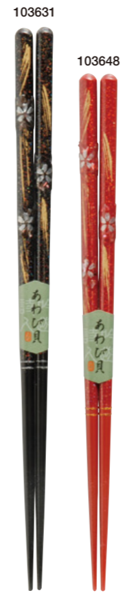
桜雨 103631 黒 23cm 103648 赤 21cm ¥1,600(+税) ●木地/天然木 ●塗/ポリエステルウレタン ●日本製 ●入数/5