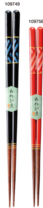
綾 109749 黒 23cm 109756 赤 21cm ¥1,200(+税) ●木地/天然木 ●塗/ポリエステルウレタン ●日本製 ●入数/5