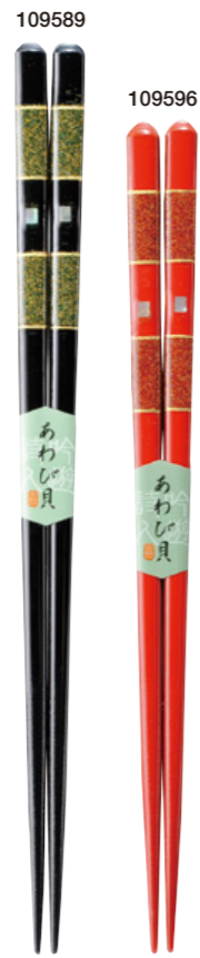
秀麗 109589 黒 23cm 109596 赤 21cm ¥1,500(+税) ●木地/天然木 ●塗/ポリエステルウレタン ●日本製 ●入数/5