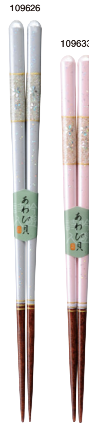
水中花 109626 ブルー 23cm 109633 ピンク 21cm ¥1,300(+税) ●木地/天然木 ●塗/ポリエステルウレタン ●日本製 ●入数/5