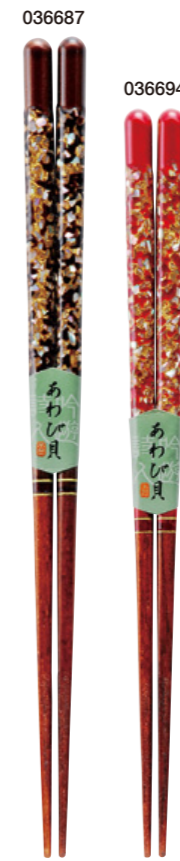
漆貝づくし 036687 黒 23cm 036694 赤 21cm ¥1,600(+税) ●木地/天然木 ●塗/漆仕上げ ●日本製 ●入数/5