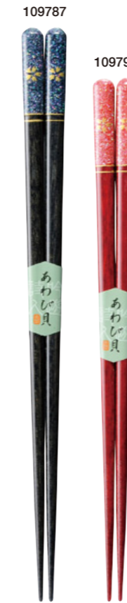
桜紋 109787 黒 23cm 109794 赤 21cm ¥1,200(+税) ●木地/天然木 ●塗/ポリエステルウレタン ●日本製 ●入数/5