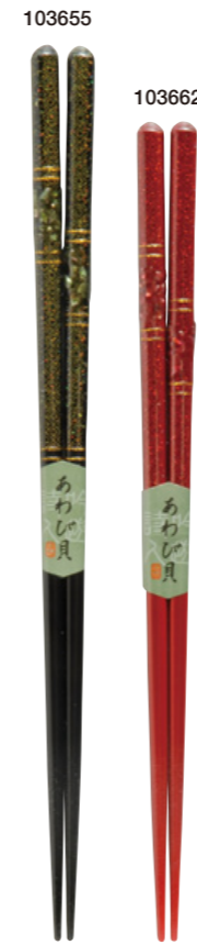
貝さざれ 103655 グリーン 23cm 103662 レッド 21cm ¥1,500(+税) ●木地/天然木 ●塗/ポリエステルウレタン ●日本製 ●入数/5