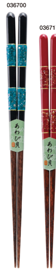
漆八百姫 036700 黒 23cm 036717 赤 21cm ¥1,500(+税) ●木地/天然木 ●塗/漆仕上げ ●日本製 ●入数/5