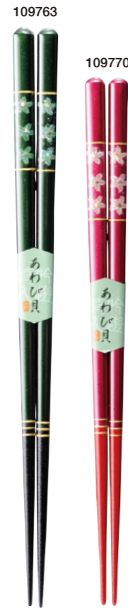
小春 109763 緑 23cm 109770 ピンク 21cm ¥1,200(+税) ●木地/天然木 ●塗/ポリエステルウレタン ●日本製 ●入数/5