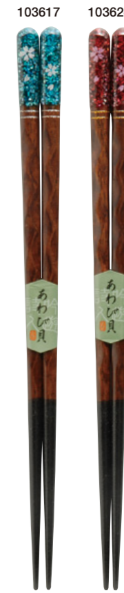
花影 103617 青 23cm 103624 赤 23cm ¥1,600(+税) ●木地/天然木 ●塗/ポリエステルウレタン ●日本製 ●入数/5