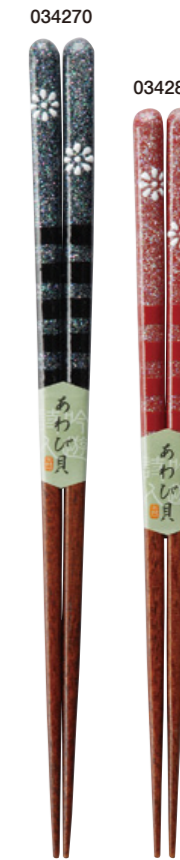
貝日輪 034270 黒 23cm 034287 赤 21cm ¥1,400(+税) ●木地/天然木 ●塗/漆仕上げ ●日本製 ●入数/5